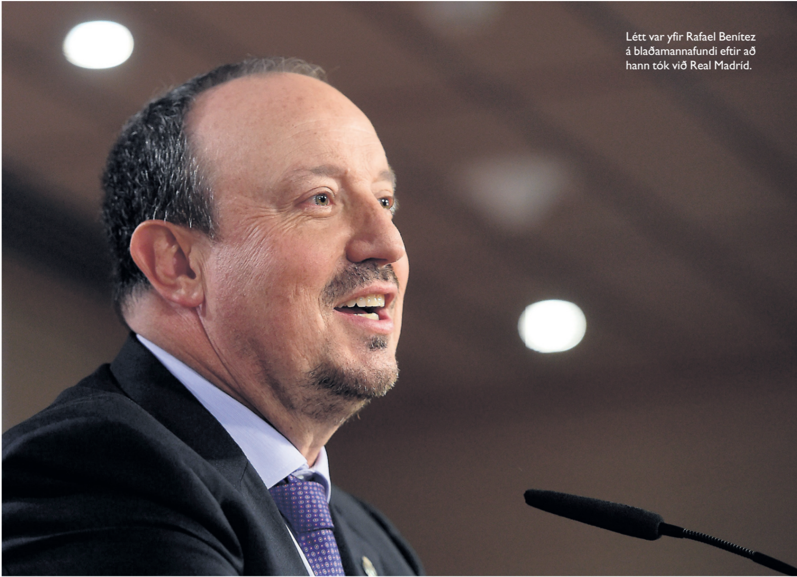
Létt var yfir Rafael Benítez á blaðamannafundi eftir að hann tók við Real Madrid.

Á æfingu í brúðkaupsferðinni Benítez lærði mikið á því að heimskegja hin ýmsu félög erlendis og kynna sér aðferðir þeirra. „Ég ferðaðist um Spán, Frakkland, Ítalíu, England, Holland og jafnvel Bandaríkinn til að fylgjast með því hvað ólíkir hjálfarar voru að gera.“ Hann minnst einnar ferðar sérstaklega, við mjög sérstök skilyrði. „Við hjónin vorum á brúðkaupsferð í Evrópu. Ein af borgunum sem við heimsóttum var Amst-