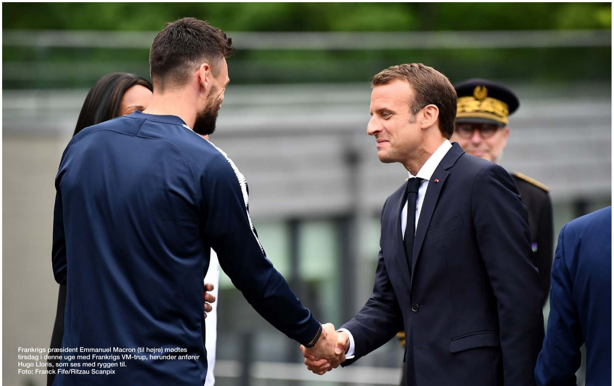
Frankrigs præsident Emmanuel Macron (til højre) mødtes tirsdag i denne uge med Frankrigs VM-trup, herunder anfører Hugo Lloris, som ses med ryggen til.

→ vigtige faktorer, men holdånden og samhørigheden er måske endnu vigtigere.”